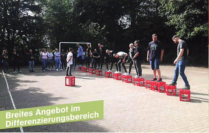
Breites Angebot im Differenzierungsbereich