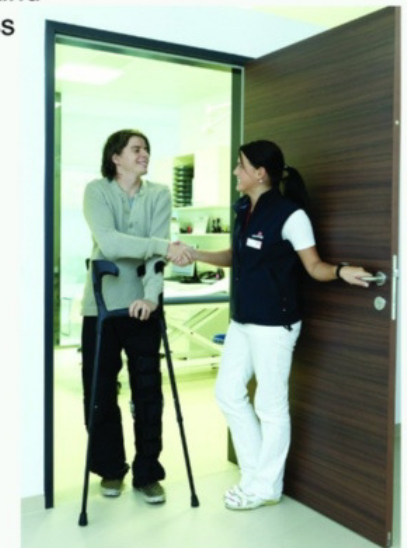
Einblicke in medizinische Berufe

Rehabilitation/Rekreation Therapeutisches Reiten Gesundheitsprävention Natur mit allen Sinnen Tanzkurs für Anfänger Erste Hilfe am Kind Yoga und Fitness Kunsttherapie Musiktherapie Ergotherapie Segeln